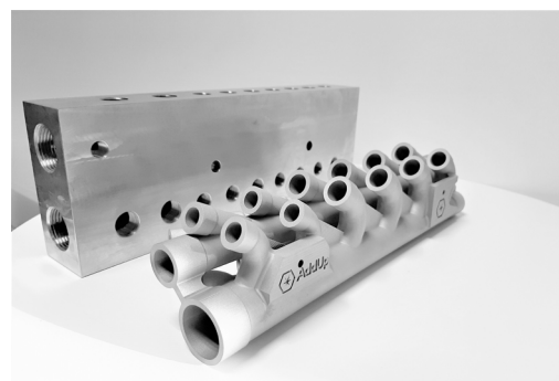
Bloc foré imprimé en 3D au premier plan et pièce d'origine au second plan.