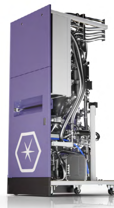
Module Poudre autonome