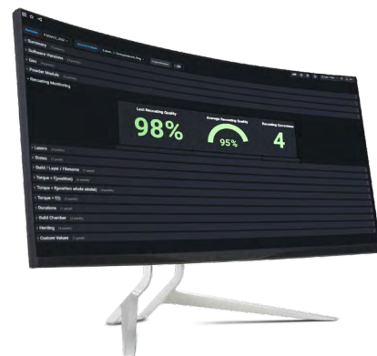
Ecran de Dashboard

La conception modulaire des machines FormUp 350 permet aux clients de configurer et de faire évoluer la machine selon leurs besoins et de bénéficier à tout moment des technologies les plus récentes, sans remplacement de la machine.